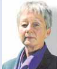
Christel Aschmoneit-Lücke, MdL verkehrspolitische Sprecherin der FDP-Landtagsfraktion SH