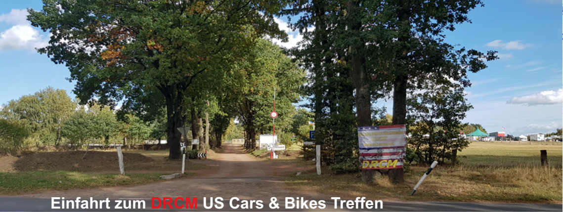
Einfahrt zum DRCM US Cars & Bikes Treffen