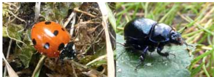
Siebenpunkt Marienkäfer und Waldmistkäfer

Käfer sind die größte Gruppe unter den Insekten. Wenn wir Insekten schützen wollen, müssen wir uns um Käfer kümmern. Sie sind faszinierende Tiere, bunt und spannend zu beobachten.