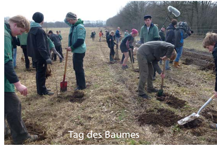
Tag des Baumes